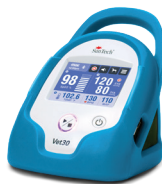
Azul "pavo real"