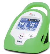
Verde "rana arborícola"