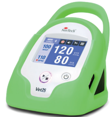
Verde "rana arborícola"