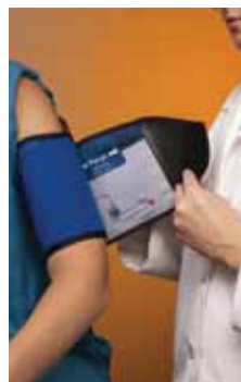
图 6: 注意核实袖带尺寸是否合适