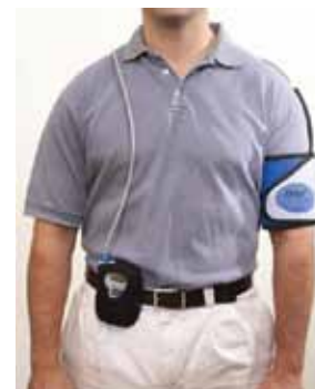
图 7: 血压计佩戴方式

时钟图标应显示在Oscar 2 显示器上以知识研究进程。患者及Oscar 2系统现在可开始 ABPM 研究。