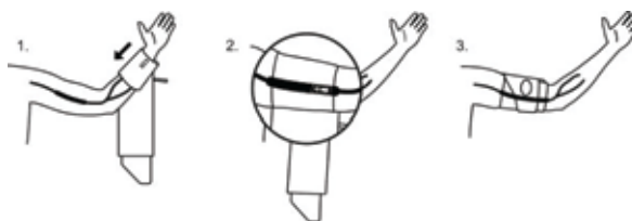
图 5: 袖带佩戴注意事项

要确定适当的监测器操作，请确保监测器处于打开状态，藉由按下“开始/停止”按钮开始 BP 读数。若出现问题，请回顾“系统设置及安装或咨询”问题解答”提示。