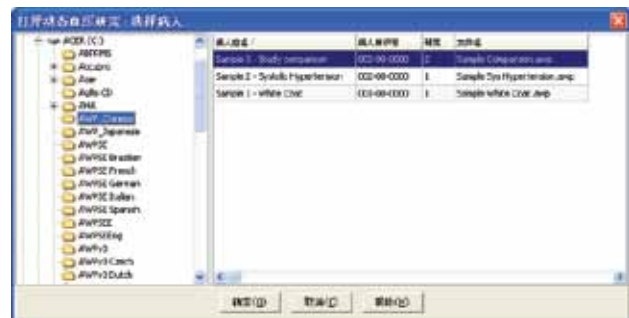
图 8. 选择病人