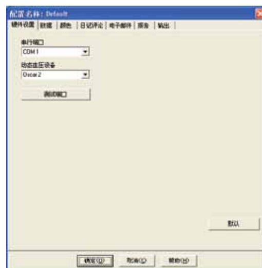
图 3. 硬件设置