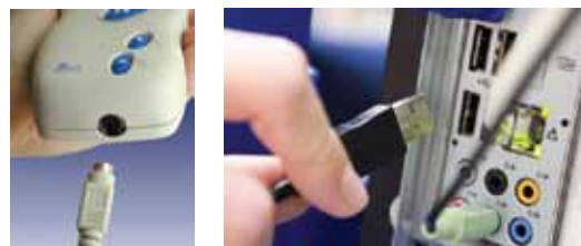
图 1: 数据线连接血压计 图 2: 数据线连接电脑