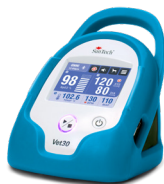
Azul "pavo real"