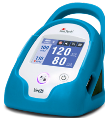
Azul "pavo real"