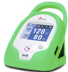
Verde "rana arborícola"